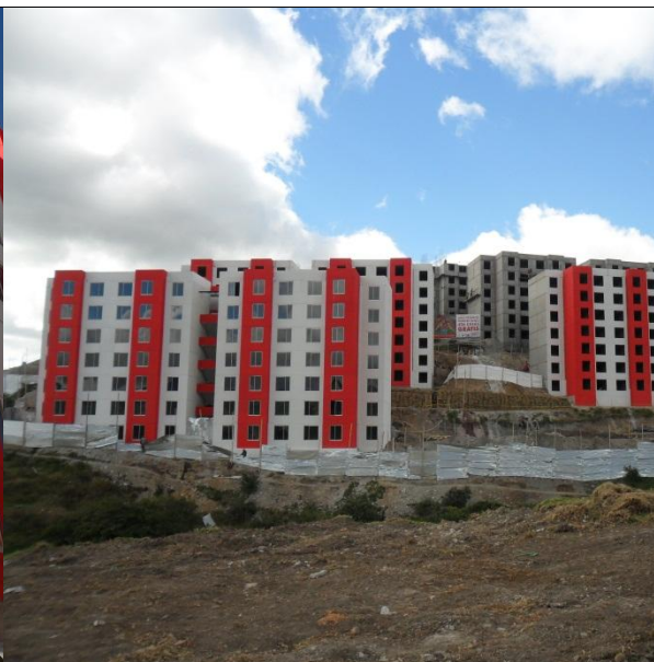
PANORAMICA DEL PROYECTO