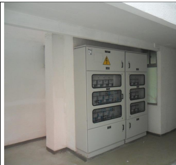
PROCESO CONSTRUCTIVO AMARRADO DE HIERRO