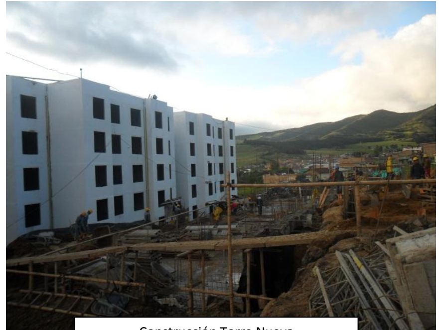
Construcción Torre Nueva