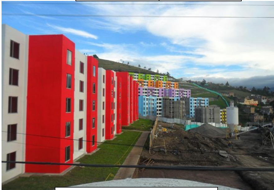
Panorámica del proyecto