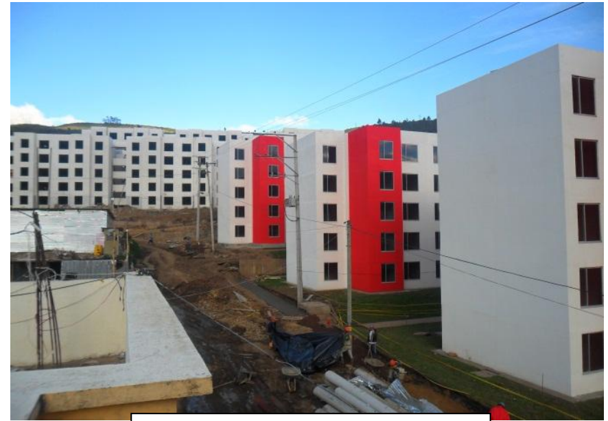
Panorámica sobre la Calle 32 E