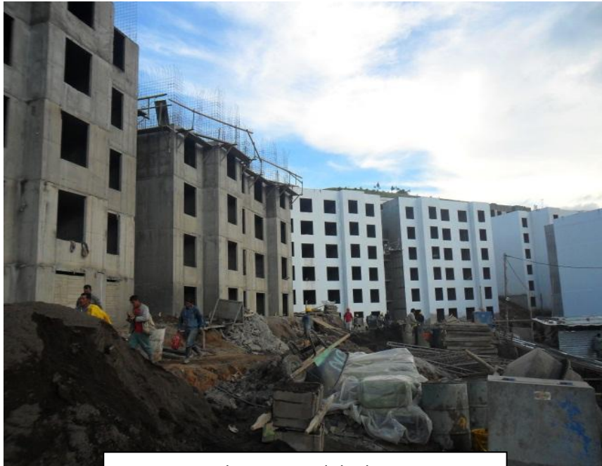
Formaleteo y Fundida de Muros