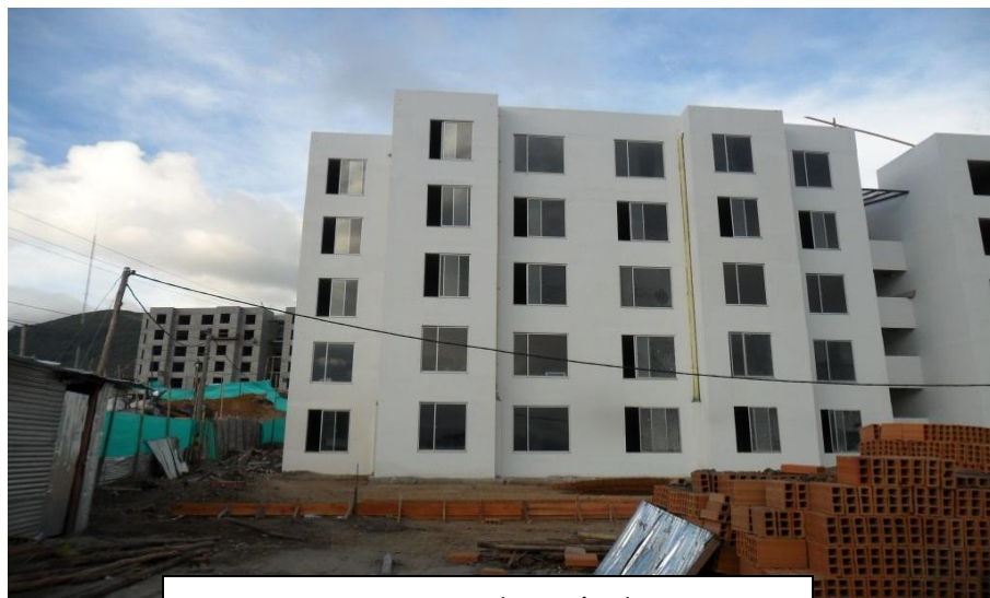
Proceso constructivo Colocación de Ventanas