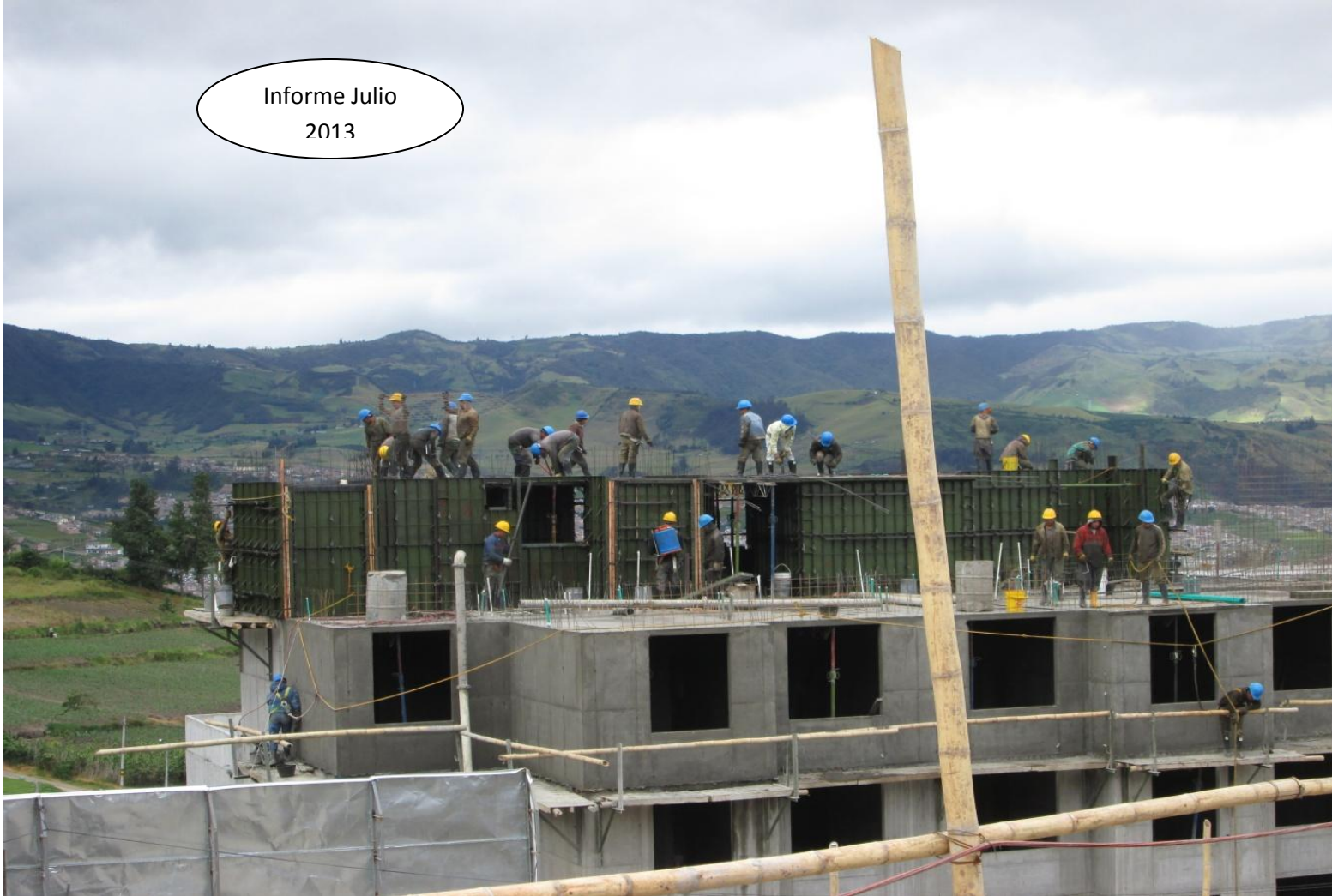
Terminación altura en el edificio 5