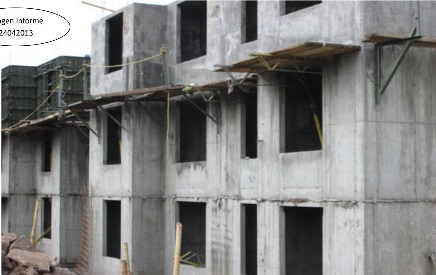
Imagen Informe 24042013