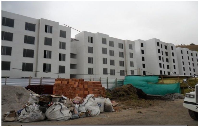
Proceso Constructivo colocación de ventanas