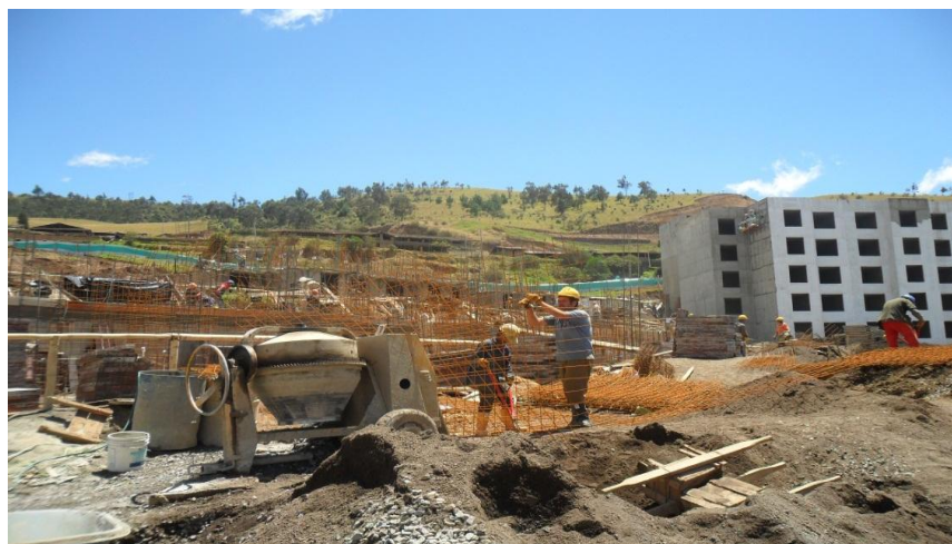
Proceso constructivo amarrada de Hierro