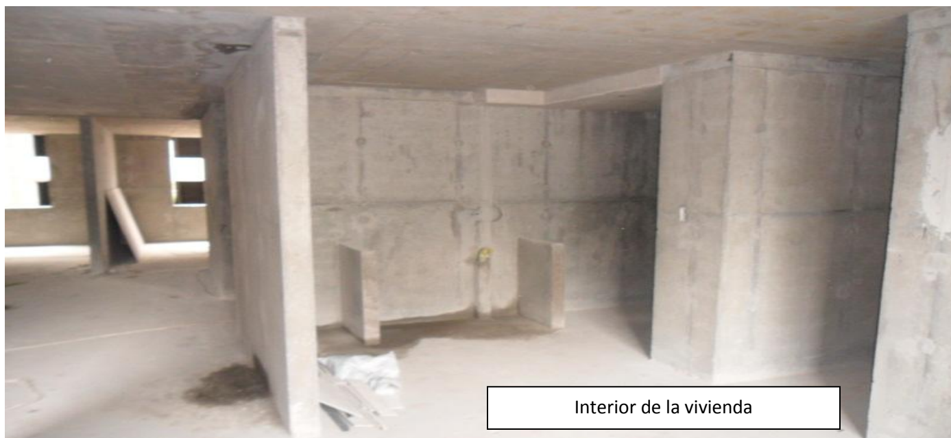
Interior de la vivienda