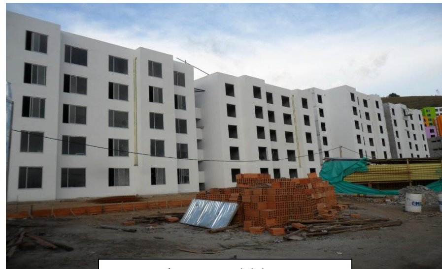
Panorámica Lateral del proyecto