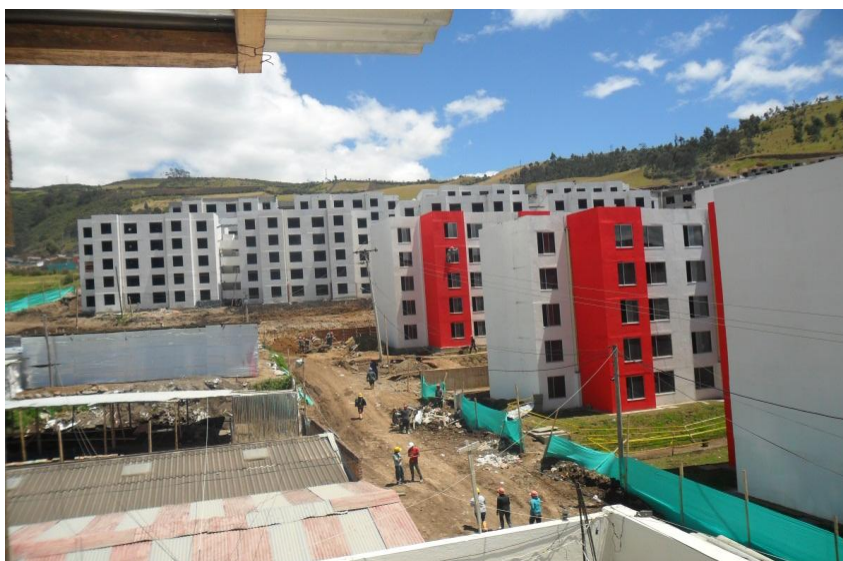
Panormámica lateral del Proyecto