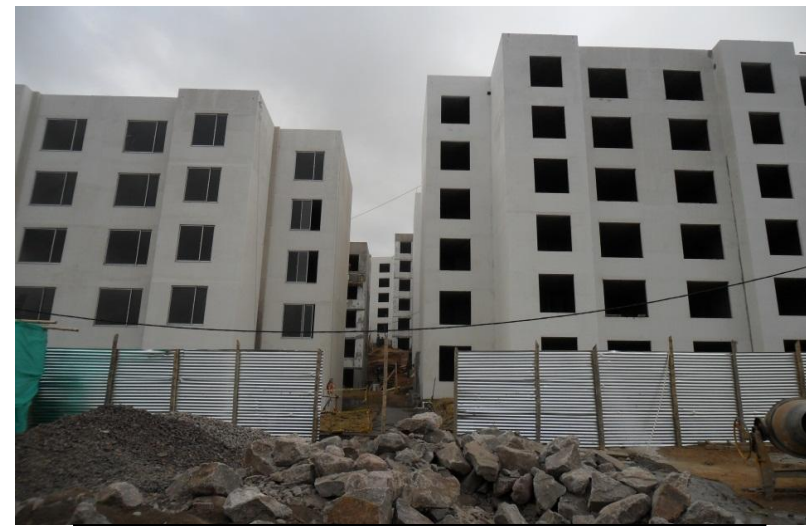
Panorámica del proyecto