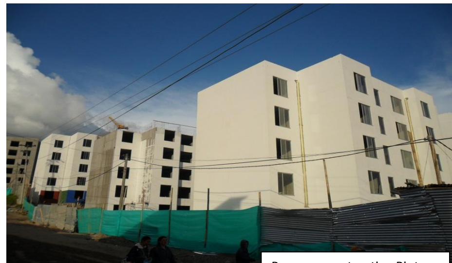
Proceso constructivo Pintura