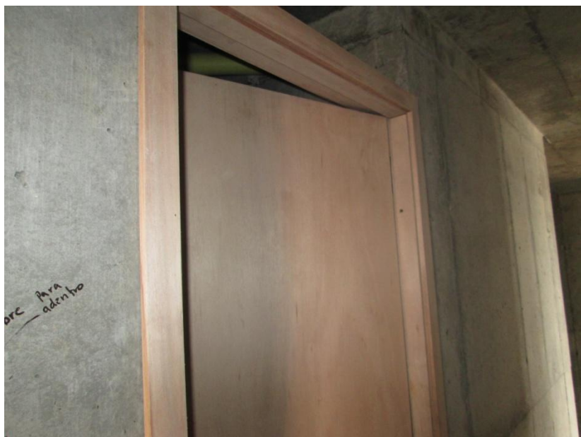
Puertas de Baño instalándose