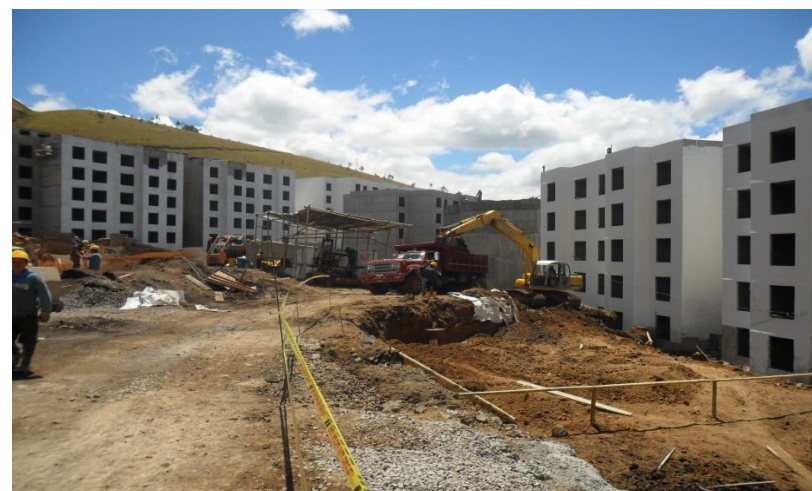
Construcción nueva torre